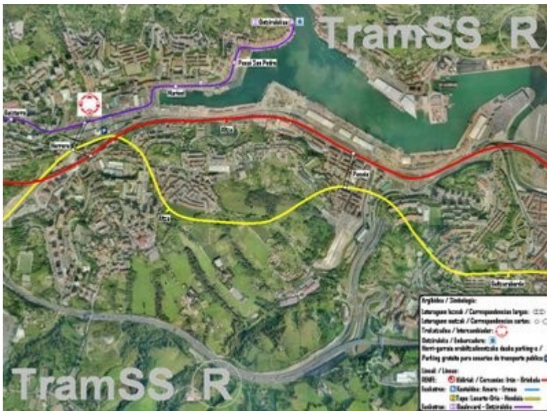
Figura 2. Propuesta del nuevo Gobierno Vasco para el barrio de Altza y Pasaia. 2. Irudia. Gaur egungo Eusko Jaurlaritzaren proposamena Altza auzoa eta Pasaiarako.

Como ya se publicó el 14 de Junio de 2009 en el Diario Vasco ( http://www.diariovasco.com/20090614/san-sebastian/topo-tendra-estacion-altza-20090614.html ) el actual Gobierno Vasco desechaba la anterior propuesta, publicada el 31 de Octubre de 2008 ( http://www.diariovasco.com/20081031/al-dia-local/altza-conectara-topo-20081031.html ), del trazado de Euskotren a su paso por el barrio Donostiarra de Altza (figura 1) y proponía un nuevo trazado (pendiente de estudio) el cual discurriría por el barrio de Altza presentando una estación en la zona del ambulatorio. Este Gobierno a su vez proponía el soterramiento del trazado de Pasaia eliminando así el molesto viaducto, que discurre entre casas. El "posible" nuevo trazado se presenta en la Figura 2., donde se traza el recorrido de la línea 3 de tranvía a su paso por el barrio Pasaitarra de Trintxerpe y Pasai San Pedro, así como una nueva estación de Cercanías que junto a la estación de Euskotren, daría servicio al nuevo ensanche del barrio de Altza.