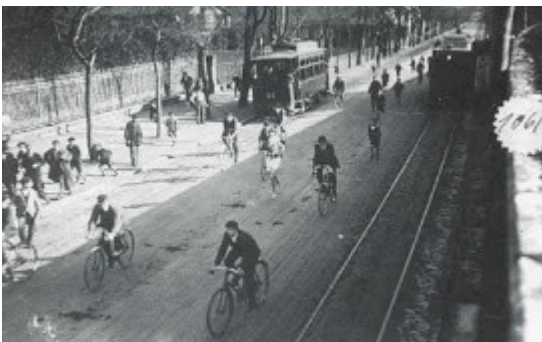
Calle Miracruz en 1930 / Mirakruz Kalea 1930an