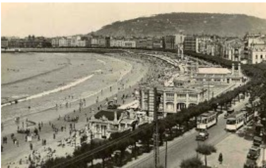
Paseo Miracóncha en 1912 / Mirakontxa Pasealekua 1912an