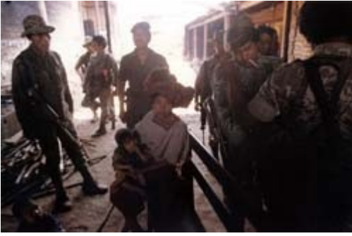
Interrogation of woman and child, suspected subversives, at army garrison, Chajul, Quiché.