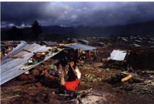
Ixil refugee and children in the New Life refugee camp, partly financed by U.S. evangelical groups, near Nebaj, Quiché.