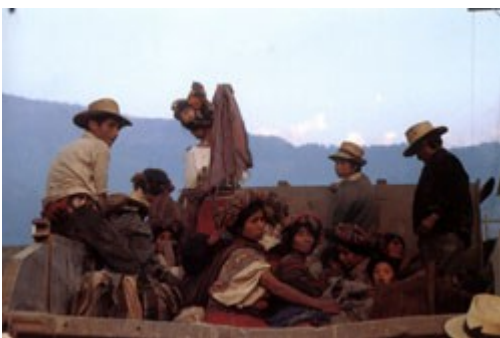
Refugees being brought into town on trucks following army sweeps into mountainsides, Nebaj, Quiche.

Documento 2 - Extracto de un análisis de Kate Doyle sobre los documentos de Operación Sofía