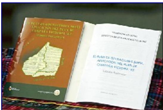
el documento es cuestionado debido a que se señala la pertinencia de la Sepaz