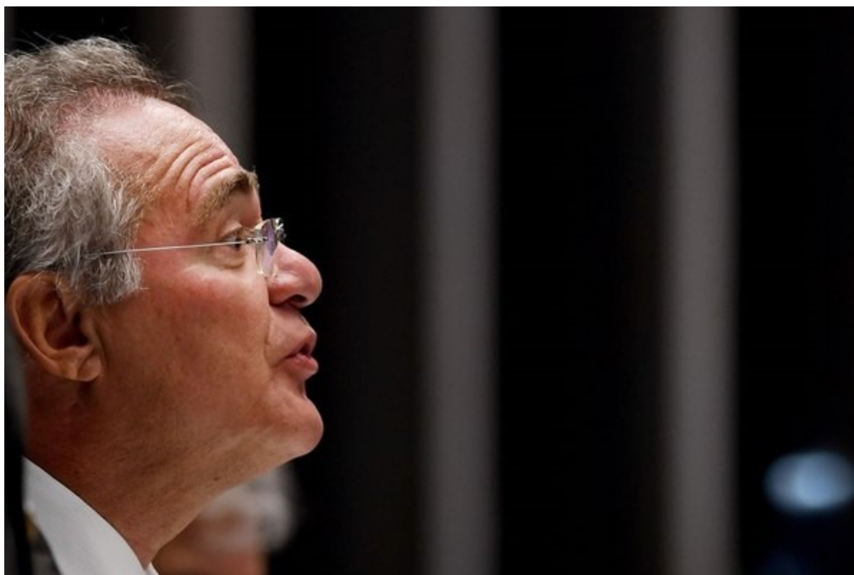
Renan Calheiros, presidente del Senado, gesticulaba el martes durante la sesión en la cual se votó una enmienda constitucional que limita el gasto público.

La enmienda del "techo de gastos" es apenas la primera del plan de ajustes de Temer. La siguiente -la reforma del sistema de jubilaciones- pretende establecer una edad mínima uniforme de 65 años para el retiro de hombres y mujeres y un periodo de contribuciones de 49 años para gozar del 100% del beneficio.