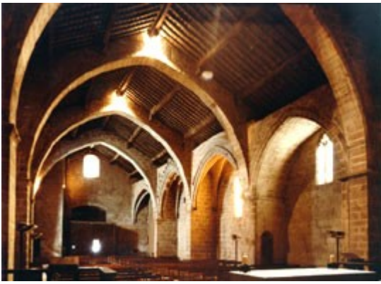
Interior de l'església de Sant Miquel, de Montblanc, on s'aplegaren les Corts diverses vegades durant el segle XIV i una vegada el segle XV.