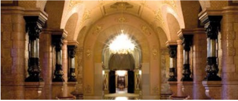
El Saló Rosa.

L'edifici del Palau del Parlament és l'antic arsenal de la Ciutadella aixecada per ordre de Felip V per assegurar-se el domini de Barcelona i, amb ell, subjectar tot Catalunya, un cop esfondrada l'11 de setembre de 1714 la llarga resistència oposada al setge de les tropes francoespanyoles.