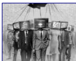
Medios pecaminosos Arpas