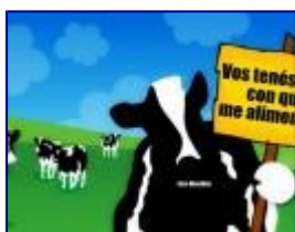
GMO: alimentar animales es más importante que a los humanos Graciela Vizcay Gomez