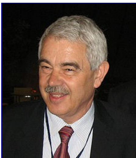
Pasqual Maragall , presidente de la Generalitat durante la tramitación y aprobación del nuevo Estatuto (2003-2006)

La reforma del Estatuto de Autonomía de Cataluña de 1979 fue una propuesta que los partidos políticos progresistas catalanes empezaron a desarrollar durante la última legislatura de Gobierno de