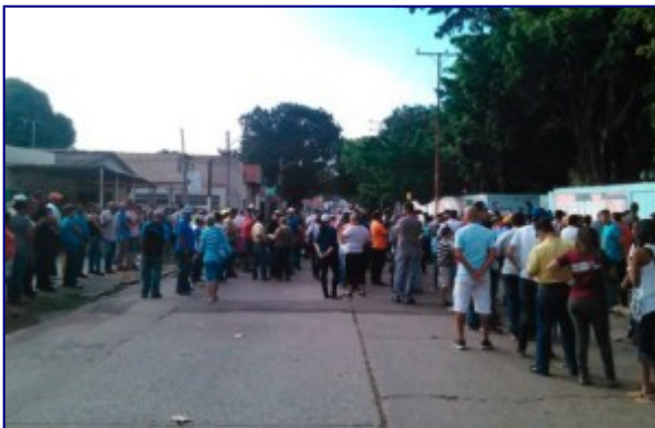
Masiva participación en parlamentarias de Venezuela

ESPECIAL VENEZUELA: HA TRIUNFADO LA GUERRA ECONÓMICA CONTRA EL PUEBLO VENEZOLANO LA OPOSICIÓN DE DERECHA VENCÍÓ EN LAS ELECCIONES LEGISLATIVAS /MUD: 99 diputados PSUV: 46 diputados y aún faltan adjudicar un total de 19 diputados