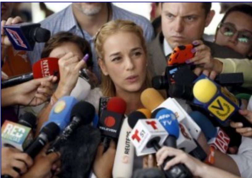
La mujer de Leopoldo López,

Lilian Tintori: «Queremos vivir un nuevo amanecer»