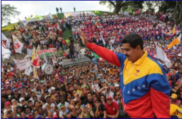
Venezuela: Aún se está a tiempo de salvar la Revolución