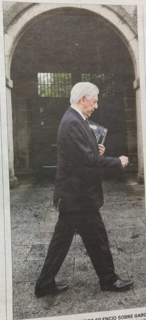
VARGAS LLOSA ROMPE SU LARGO SILENCIO SOBRE GABO. El escritor y premio Nobel Mario Vargas Llosa (en la foto) disertó en El Escorial sobre otro gigante de la literatura latinoamericana, también Nobel, Gabriel García Márquez. El narrador peruano habló de lo que les unió y les desunió, de cuando fueron amigos y cuando no tanto. Y, sobre todo, de las virtudes literarias del colombiano. PÁGINA 22

Sánchez se alineó con Rajoy en su decisión de no permitir que se celebre el referéndum independentista anunciado para el 1 de octubre, pero pidió al presidente que dialogue con la Generalitat para tratar de parar el desafío. Si el Gobierno no da el paso, le advirtió el líder socialista, el PSOE no descarta presentar iniciativas propias en busca de soluciones, incluida una reforma de la Constitución. PÁGINAS 14 Y 15