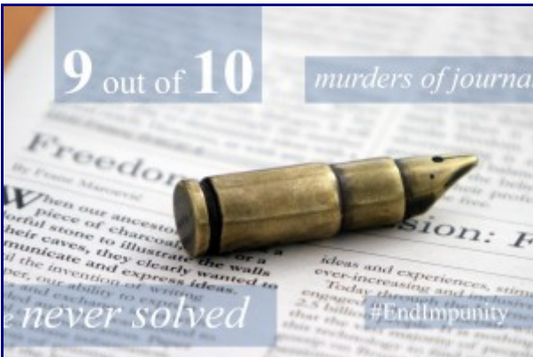
International Day to End Impunity for Crimes Against Journalists More info...