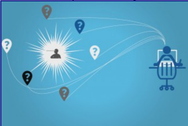
Intermediaries: a direct and effective role in #OpenJournalism? More info...