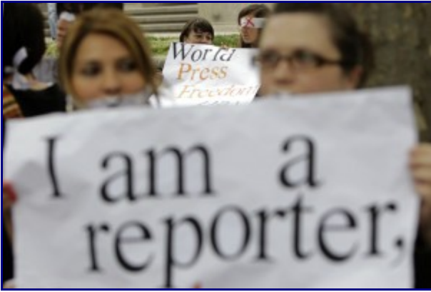
Press freedom: The everyday fight #WPF2015 More info...