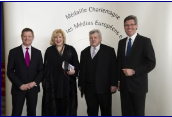
Media freedom representative Mijatović awarded Médaille Charlemagne More info...