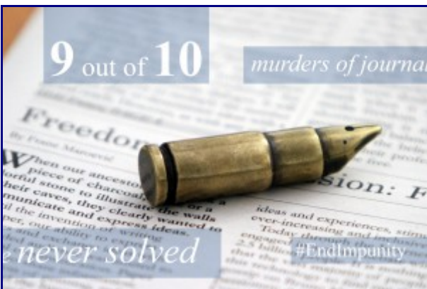
International Day to End Impunity for Crimes Against Journalists More info...