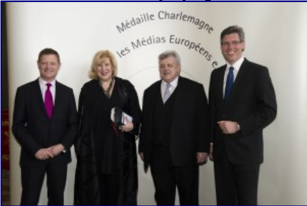
Media freedom representative Mijatović awarded Médaille Charlemagne More info...