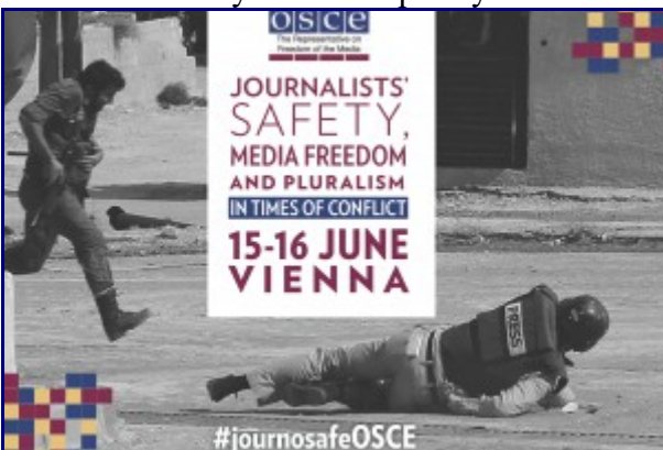
Under attack: journalists and journalism More info...