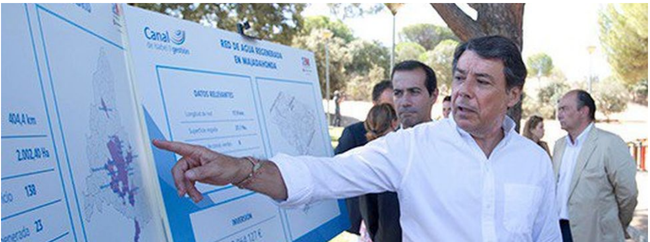
El PP robaba dinero público del Canal de Isabel II à su financiación (14)