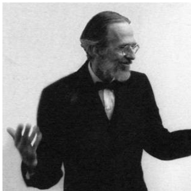
Crumb en 2004

El contenido del folleto ha sido aprobado por la junta directiva de Rethinking AIDS y está ilustrado por R. Crumb, el célebre dibujante de comics contraculturales. Crumb es conocido por Mr. Natural the keep on Truckin comic, y Fritz and the cat.