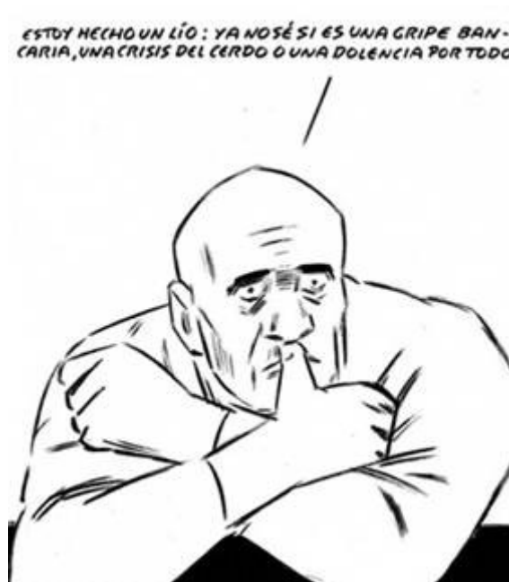
Chiste : el Roto

La gripe A causó en Polonia el mismo número de muertos que en el resto de Europa, es decir, 181 muertos para unos 39 millones de habitantes. En España ha habido 251 fallecimientos, contra 18.000 previstos (para unos 47 millones de habitantes). En el Reino Unido han sido 344 los