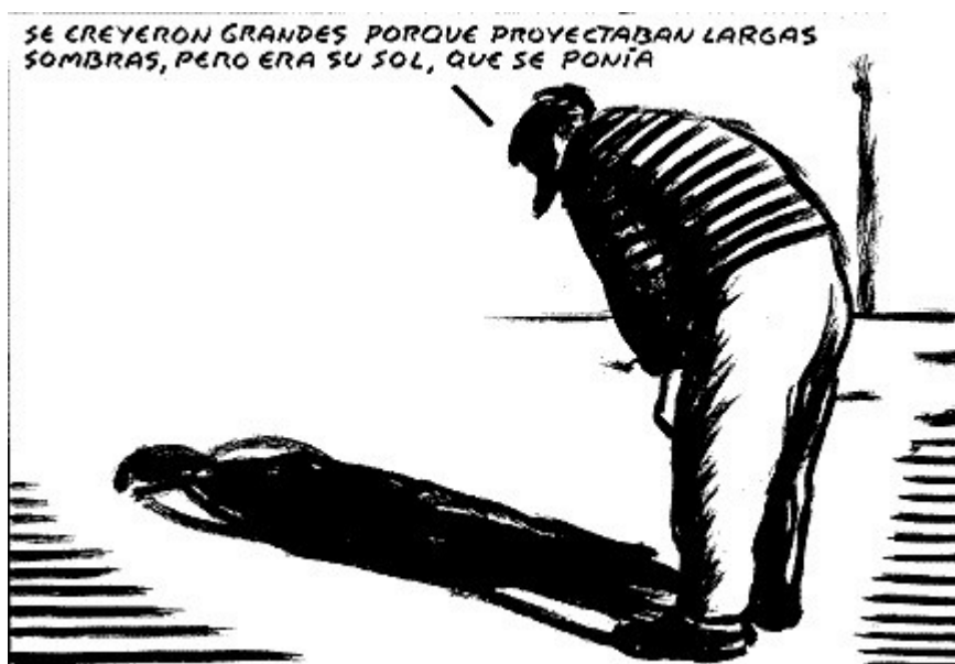
Chiste : el Roto