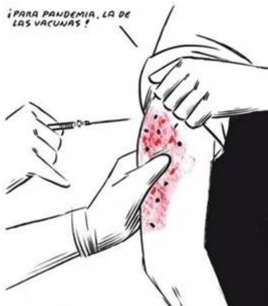
Chiste : el Roto

Las vacunas contra la gripe son de escasa efectividad, muy inútiles tanto en niños como en ancianos [20][21] . Las vacunas son con virus inactivados y logran una débil respuesta inmunitaria. Se han comercializado con estudios de bajísima calidad, sin ensayos clínicos a largo plazo [22][23] . Gran parte del efecto que se les atribuyen se debe al sesgo de “selección” (los que se vacunan tienen mejor salud que los que no se vacunan) [24] .