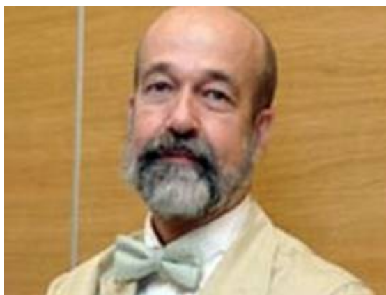
Dr. JUAN GÉRVAS

*El autor no tiene más afán que dejar claro el estado del conocimiento respecto a la gripe A en el momento de escribir este texto, y para ello ha revisado la literatura mundial al respecto. Este texto es puramente informativo. El autor lamenta que muchos de los organismos públicos, las sociedades científicas y los medios de comunicación transmitan otro mensaje; sus razones tendrán.