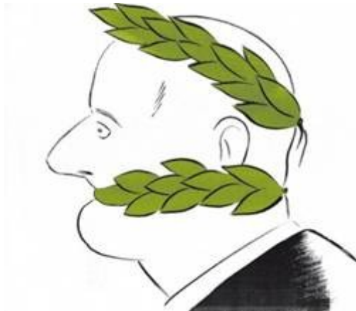
Chiste : el Roto

Los políticos que han gestionado la crisis de la gripe A como si fuera una gripe Aviar sin control aluden de continuo al “principio de precaución” como justificación. La gestión del riesgo se transforma en imaginar el peor escenario posible y en emplear cientos de millones de euros en España (y miles de millones en el mundo) para prepararnos ante el Fin del Mundo. La crisis ante la gripe A es, pues, una crisis básicamente creada por la propia gestión, por la incoherencia e irresponsabilidad de las autoridades sanitarias (con el “principio de precaución” como paraguas para decidir sin sentido). Es como si la Dirección General de Tráfico quisiera eliminar la mortalidad en carretera prohibiendo la circulación de todo tipo de vehículos para siempre, “por el principio de precaución”.