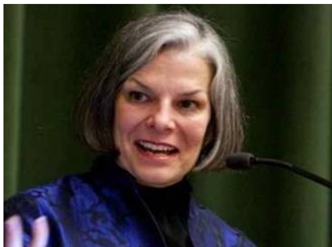
- Julie Gerberding -

Falta transparencia sobre la gestión de la crisis de la gripe A y, por ejemplo, la Organización Mundial de la Salud (OMS) se niega a revelar los conflictos de interés (con las industrias) de sus expertos “para proteger su privacidad” (7).