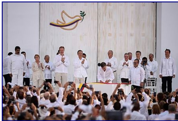
Ceremonia de firma del acuerdo final de paz el 26 de septiembre de 2016 .