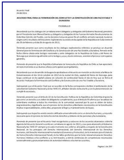
Foto de la primera página del «Acuerdo Final Para La Terminación Del Conflicto Y La Construcción De Una Paz Estable Y Duradera» ( texto completo aquí ) publicado 24 de agosto de 2016.

La agenda estuvo integrada por cinco puntos, algunos de los cuales coincidían con proyectos que el gobierno de Santos previamente había impulsado, como un proyecto de ley del ministro de agricultura Juan Camilo Restrepo , la Ley de Víctimas y la Comisión de la Verdad.